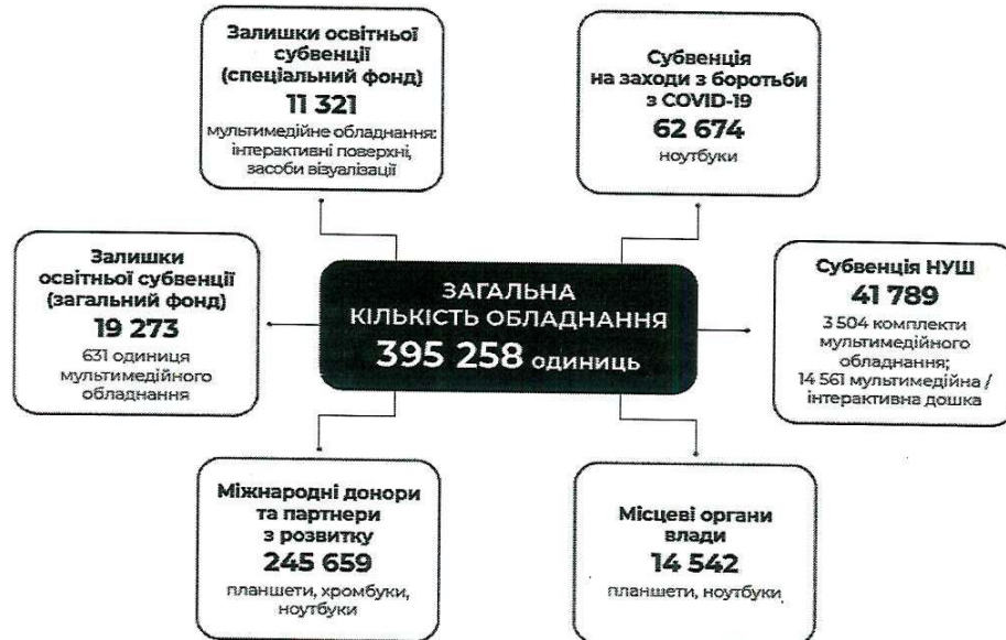
Схема 1. Напрями та джерела фінансування / постачання цифрових засобів

➤ забезпечено підвищення кваліфікації педагогічних працівників, зокрема з розвитку цифрових компетентностей на 1 527,0 млн грн (щорічно від 31,6 тис. до 194,3 тис. осіб);